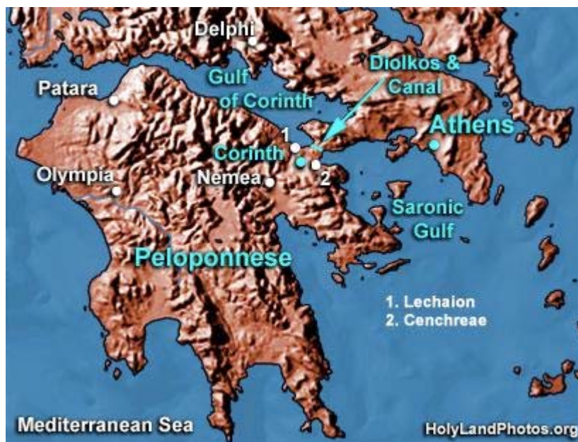
Figura 2.- Situación de Olimpia en Grecia. Península del Peloponeso. http://www.triptroupe.com

debían traspasar. Contiguo al estadio estaba el hipódromo con una extensión de 770 metros. Además existía la Palestra, planta cuadrada de 66 metros de lado, con una superficie interior de arena, donde se realizaban los entrenamientos para la lucha. Por último había un Gimnasio, en el que se llevaban a cabo los entrenamientos para el resto de las pruebas, contaba con una galería lateral, tan amplia, que permitía el entrenamiento de la carrera en los días de lluvia. Las mujeres, cuya EF era inexistente, tenían también prohibida la entrada para presenciar la olimpiada, aunque, en ocasiones, se realizaban otros juegos paralelos dirigidos exclusivamente a ellas.