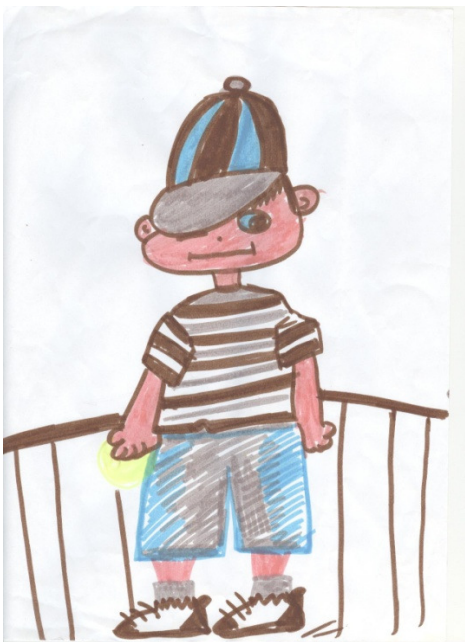
Figura nº 1.- Ilustración de Zapatones. MD Zagalaz

Las capacidades perceptivas , que habrá de adquirir el niño/a durante la etapa de educación infantil (EI), tales como recibir e interpretar estímulos del exterior, in-put), y de expresión (exteriorizar o manifestarse, out-put) son esenciales en la Educación Musical y Física, áreas que no aparecen implícitamente en EI pero que conforman los contenidos de las tres áreas que integran el currículum de estos primeros años escolares. Así se pone de manifiesto en los documentos oficiales, los cuales organizan la Educación Artística en los dos grandes ejes, percepción y expresión, en torno a los cuales giran los bloques de contenidos de cada lenguaje. En este caso, trabajaremos con la expresión corporal esencialmente (movimiento expresivo, técnicas de representación, coreográficas), aunque nos serviremos interdisciplinariamente de la musical (como apoyo - percepción- o para expresar sonidos vocales o instrumentales conjuntos con el cuerpo), literaria (para comunicar sensaciones a través de la palabra), de la plástica (como inspiración o como apoyo escenográfico), y globalmente de la dramática (representaciones, montajes de un cuento motor, de una historia, puesta en escena, etc.). Ayala (2008).