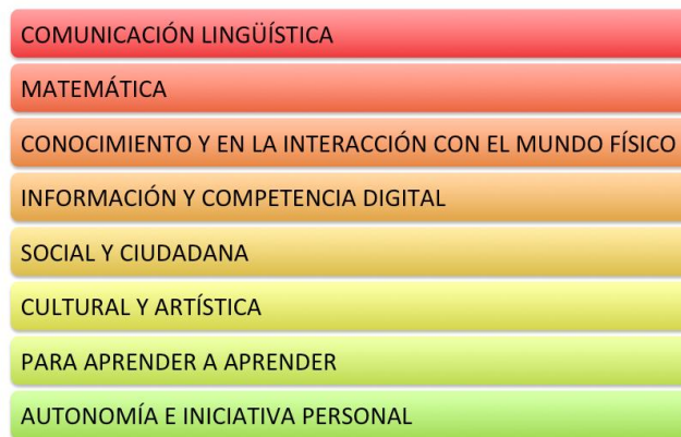
Figura 2. Competencias básicas de la etapa de Educación Primaria

Continuando con el trabajo que presentamos, estas competencias en el marco educativo, se han definido en un total de ocho, recogidas en el REAL DECRETO 1513/2006, de 7 de diciembre, por el que se establecen las enseñanzas mínimas de la Educación Primaria, las siguientes competencias básicas son: