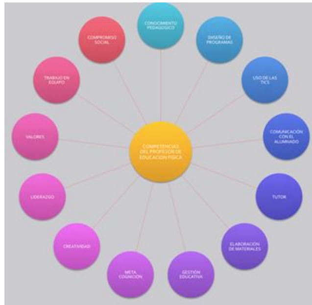
Figura 3. Competencias profesionales del docente de Educación Física.

que se imparten en estas etapas. Por ello, el docente que imparta clase en el área de Educación Física debe tener una serie de competencias profesionales que haga de su labor mucho más que una simple tarea, una forma de vida. Las competencias son: