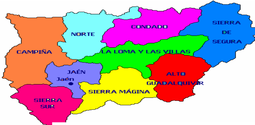
Gráfico 1: Mapa comarcalizado de la provincia de Jaén

comarcas. Gráfico 1, analizando la tipología y el estado de las instalaciones deportivas y otros espacios complementarios.